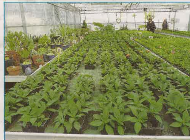
La production communale est chaque année impressionnante.

Samedi 29 avril, la municipalité d'Etréchy ouvrait les portes de ses serres au public. Chaque année, la mairie et ceux qui y travaillent présentent leurs nouveautés et l'avancée des pousses des années précédentes. Au cours de cette journée, ce sont plus de deux cents personnes qui se sont succédé dans les rangs de plantes. Des amateurs éclairés aux simples curieux, tout le monde a trouvé de quoi s'intéresser. De plus, durant les quinze jours précédents, les classes des écoles de la ville sont également venues visiter le site. « Cette année nous avons eu de nouvelles espèces, comme des pétunias qui consomment peu d'eau, ou des