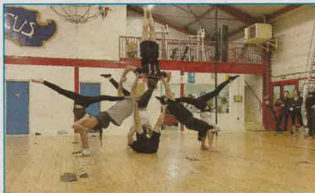
Depuis 90 ans, les Strépiniaicois vivent chaque année au rythme des représentations du 1 er cirque amateur de France.